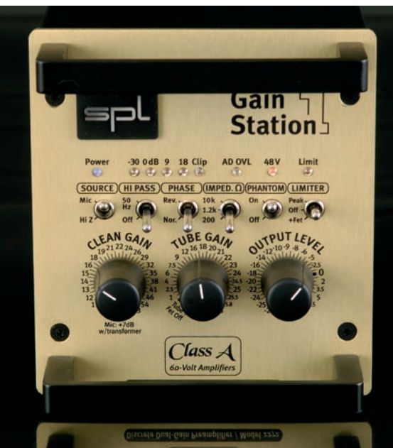
Der SPL Gain Station 1 ist ein ausgezeichnet klingender Allrounder mit sehr guter Ausstattung.

Die Gain Station 1 der SPL Electronics GmbH in Niederkrüchten bei Mönchengladbach fällt in jeder Beziehung aus dem Rahmen. Da ist einmal das äußerst kompakte und vergleichsweise schwere, solide Gehäuse. Die in edlem Gold eloxierte Front ist drei Höheneinheiten hoch (122 Millimeter) aber auch nur genauso breit. Zwei handliche Griffe oben und unten prädestinieren das sehr gut verarbeitete, handliche Gerät für den mobilen Einsatz, eine praktische Trage-